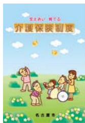
介護保険制度案内パンフレット