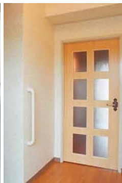
玄関ホールへの手すり設置例