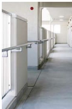
共用廊下への手すり設置例