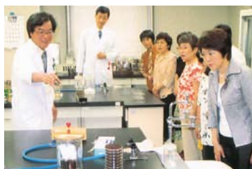
食品安全・安心学習センターでの検査体験