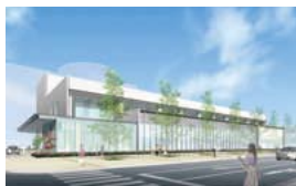
陽子線がん治療施設外観