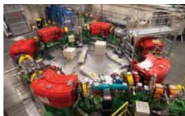
加速器室 (シンクロトロン)