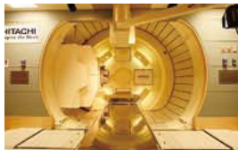
回転ガントリ照射室