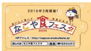
「なごや食フェスタ2010」案内