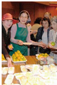
市民による健康づくりイベント