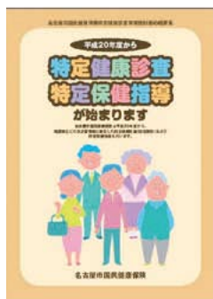
特定健康診査・特定保健指導パンフレット