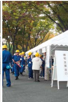
帰宅困難者への対応訓練