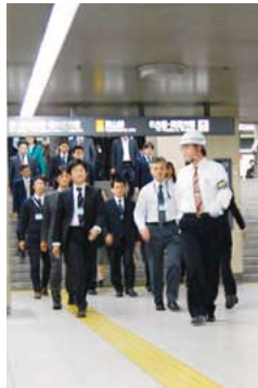
地下鉄構内から滞留者を誘導