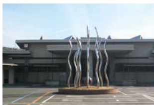
シンボルタワーの撤去後