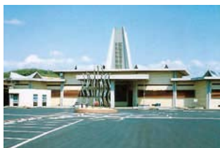
シンボルタワーの撤去前