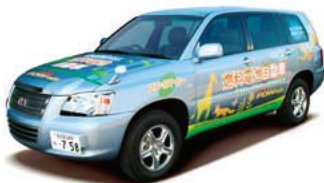
公用車として導入された燃料電池自動車