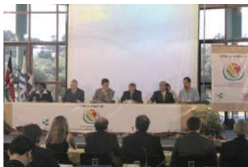
2007年にブラジルのクリチバ市で開催されたCOP8の会議風景