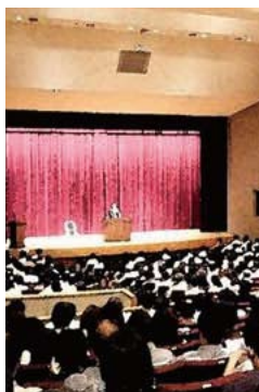
嘱託員の研修風景