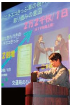
すみやか業務改善運動「なごやかカップ」