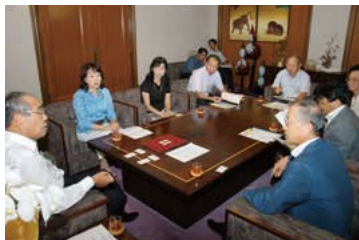
弁護士会との懇談