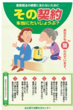
消費生活センターポスター