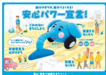
「安心・安全で快適なまちづくりなごや条例」周知ポスター