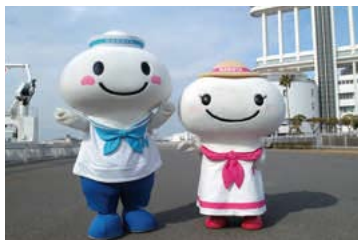
名古屋港のマスコットキャラクター、ポータン・ミータン