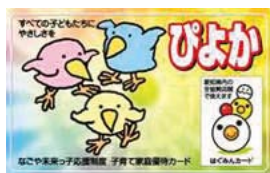
子育て家庭優待カード「びよか」