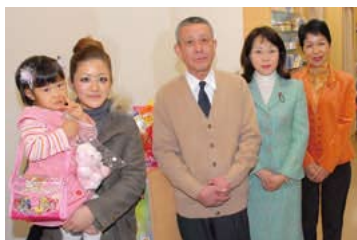
「びよか」協賛店舗を視察