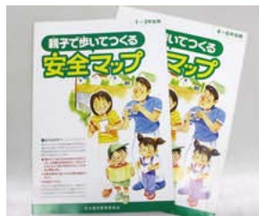
「親子で歩いてつくる安全マップ」手引き書