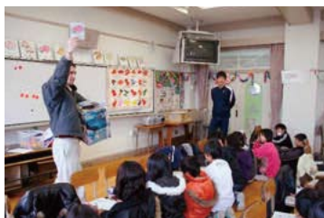
小学校の英語活動