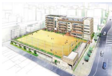
笹島小学校・中学校校舎完成予想パース