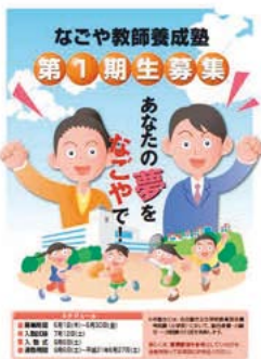
なごや教師養成塾のチラシ