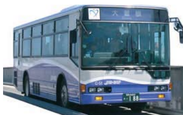
ガイドウェイバス