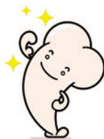
骨粗しょう症検診イメージ