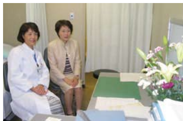
開設時の市立大学病院女性専門外来を視察