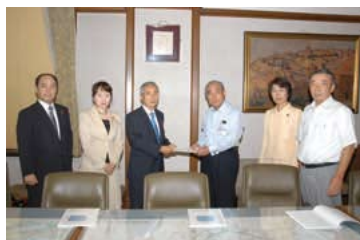
長期展望に立った予算要望を提出