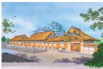
本丸御殿完成予想パース