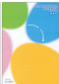
名古屋新世紀計画2010第3次実施計画