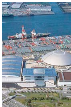
名古屋市国際展示場