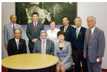
トリノ工科大学との共同研究を視察